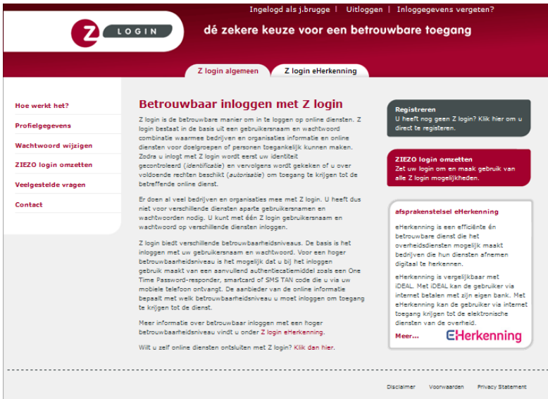
Figuur 3, wachtwoord wijzigen

Let op. Ook de OTP responder, die u van ZET solutions heeft ontvangen, dient eenmalig te worden geactiveerd bij ZET-solutions. Hoe dat in zijn werk gaat kunt u lezen in de brief van ZET- solutions.