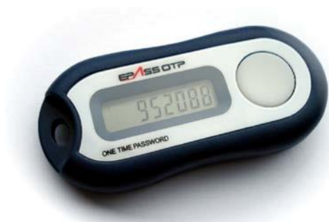
Voorbeeld weergave van Z login OTP responder

Voor VetCIS is voor de sterkte van het eHerkenningmiddel gekozen voor het betrouwbaarheidsniveau "midden". Dit is ook het niveau waarmee banktransacties worden bevestigd. Naast de Z login gebruikersnaam en wachtwoord wordt de tweede factor ingevuld door een Z login One Time Password (OTP) responder. De OTP responder is een klein apparaatje dat een OTP (one time password) genereert wanneer door de dierenarts op het knopje wordt gedrukt. De OTP responder is gepersonaliseerd en wordt verstrekt aan een dierenarts. De OTP responder geeft na het indrukken van een knop een code die eenmalig geldig is. Deze combinatie, wachtwoord en OTP, wordt gebruikt om een persoonlijke digitale (geavanceerde) handtekening te plaatsen bij het medicijnlogboek. Op deze wijze kan de DA(P) achteraf altijd aantonen welke dierenarts de medicijnverstrekking heeft geautoriseerd.